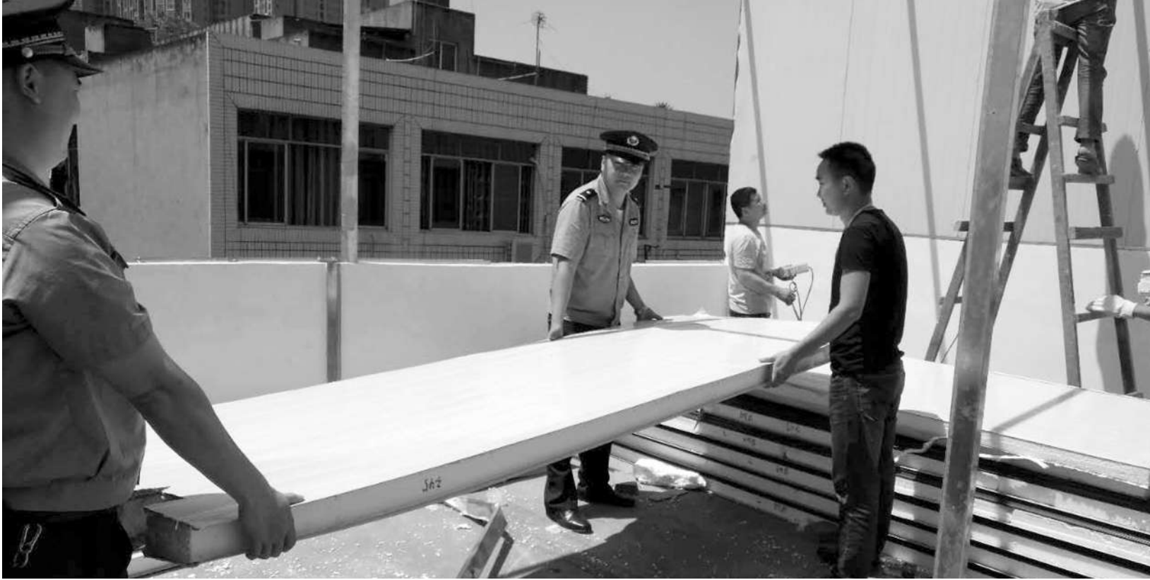
执法人员坚决拆除楼顶违建

成都天府新区全面清查并处理城市建成区、城市规划区违法建设,坚决遏制新增违法建设。5月12日,执法人员用了整整12个小时,将位于天府新区华阳街道白马寺社区河池小区涉及6户、1000余平方米违章建筑拆除。