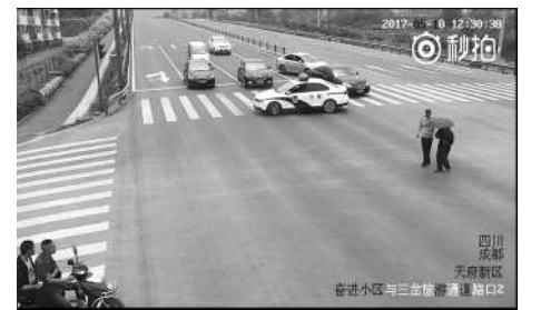
民警用警车拦路过往车辆,护送老人过马路(视频截图)

把警车紧急停在马路中间后,身着警服的他指挥过路的车辆先停下,接着奔向视频外的另一个方向,9秒后他扶着一位老人进入画面。5月10日,一段长约55秒的小视频在微博上引发网友点赞,“很暖心”“满满的正能量……”