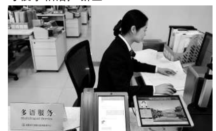
简化手续、方便快捷成为创新型企业家入驻天府新区的一大优势