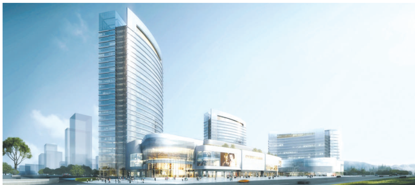
天府国际保税商业中心立面效果图

随着天府新区规划出台,外界时刻关注着新区高端产业、重大项目的规划建设。日前,记者采访得知,天府新区“四大工程”之一、被纳入省重点项目规划的“天府国际保税商业中心”(以下简称“天府保税中心”)正处于紧锣密鼓的建设中,预计于2020年底建成。建成后,天府国际保税商业中心将形成“线上线下,前店后仓”升级版体验式的全球产品贸易中心。